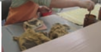
じゅたくさぎょう 受託作業（ボルトのワッシャーセット）

じかい かつどう くわ しょうかい ※次回は「どんな活動をしているの？」を詳しくご紹介します！